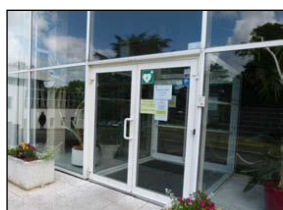
Entrée Rectorat de Nantes

Les Unions des Pays de la Loire ont décidé de rencontrer M. le Recteur d'Académie en 2015.