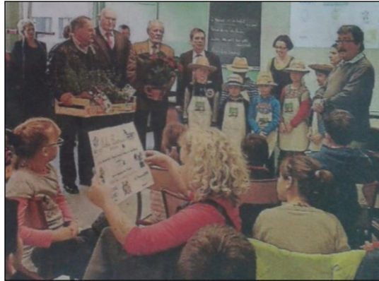
Remise des prix au Lycée agricole le Fresne

C'est le mercredi 19 novembre qu'au Lycée Agricole du Fresne s'est déroulée la cérémonie de remise des prix aux écoles ayant participé au concours des écoles fleuries pour l'année scolaire 2013/2014.